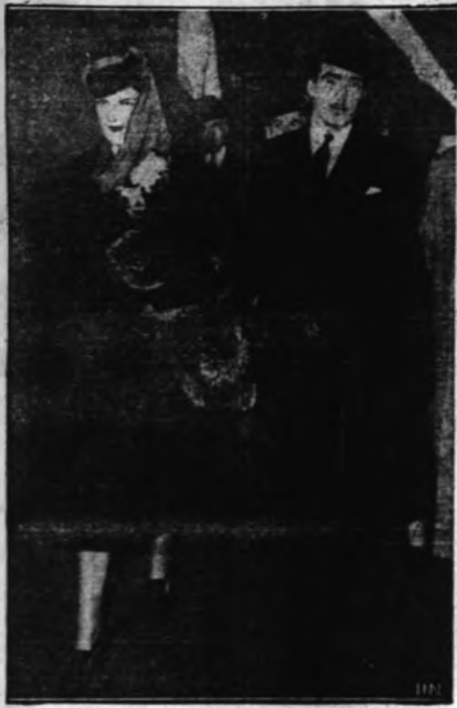
Mr. and Mrs. Anthony Eden in Washington

Handsome Anthony Eden, former British foreign secretary, and his attractive wife, shown at a Washington rail station, captivated capital folk during their day's visit, which included a call at the White House and a tour of Washington's home at Mount Vernon, Va.